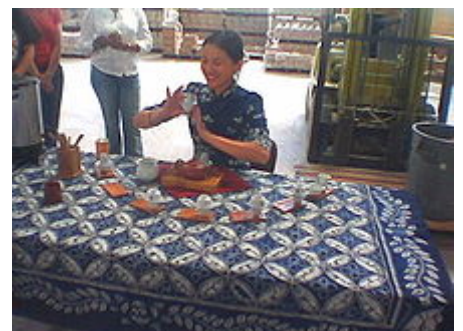
Tournage des tasses pendant le gong fu cha .

Le gong fu cha est souvent qualifié improprement de cérémonie : c'est en réalité une méthode très codifiée de préparation du thé. En effet, dans le gōngfū chá , la notion de sacré peut exister, mais n'est pas fondamentale ni même nécessaire à l'événement. Les étapes précises à suivre pour le service du thé dans ce cadre ne servent qu'à sublimer le goût du thé et à proposer un service raffiné.