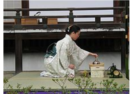
Un exemple de cérémonie du thé au Japon .

La cérémonie du thé décrit les différents modes de préparation du thé lorsqu'ils sont assortis d'une cérémonie. Cette ritualisation de la consommation du thé est une pratique courante dans plusieurs cultures asiatiques, et l'on peut citer les cérémonies du thé japonaise ( chanoyu ) et chinoise ( gong fu cha , formellement une méthode plutôt qu'une cérémonie), mais également indienne, taïwanaise et vietnamienne.